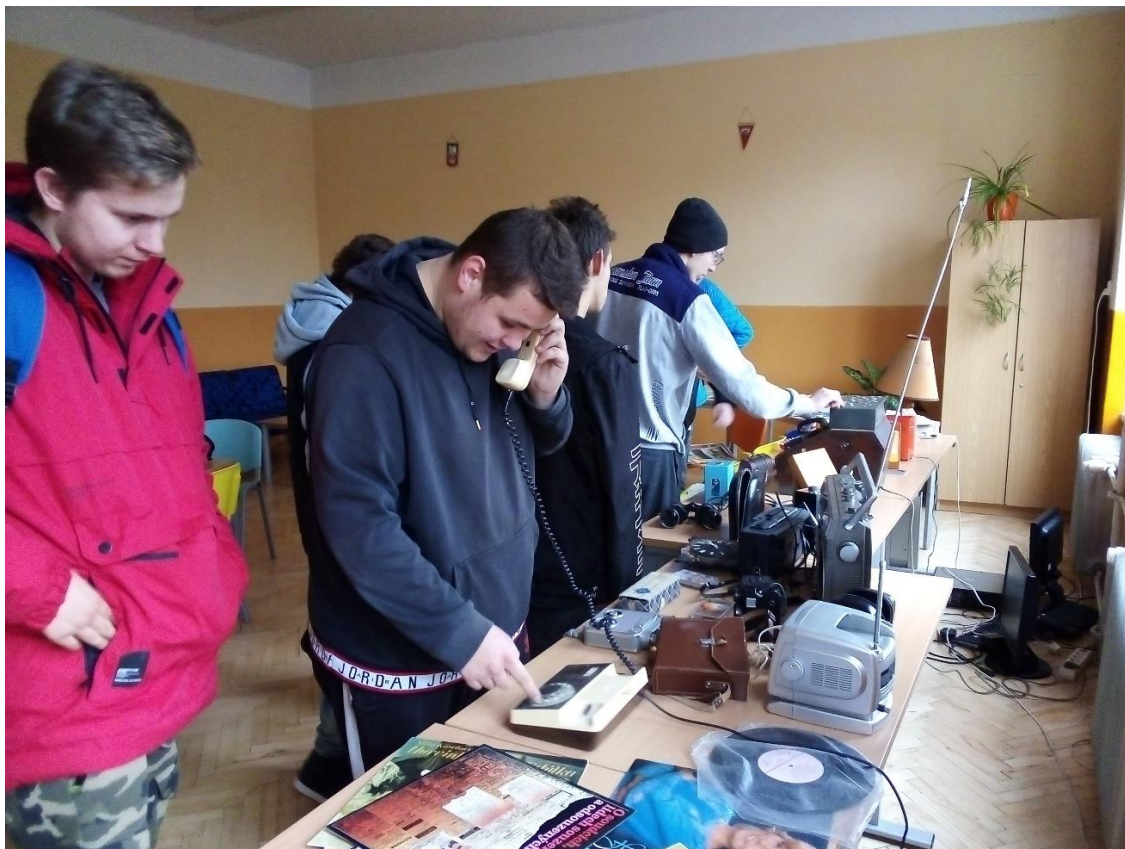
Obrázek 2 Retrovýstava

V rámci projektu 30 let svobody jsme pro veřejnost uspořádali retrovýstavu, na které si mohli rodiče a prarodiče zavzpomínat na doby minulé.