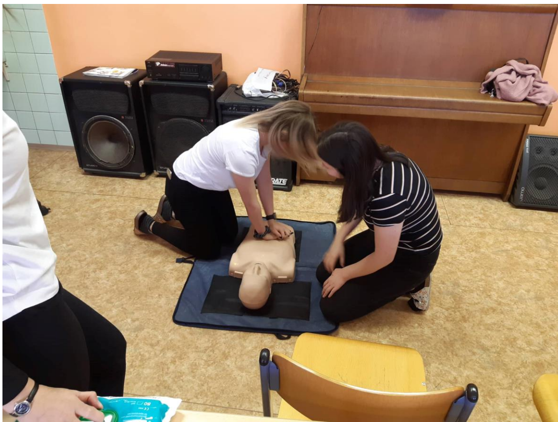
Obrázek 3 Den prevence