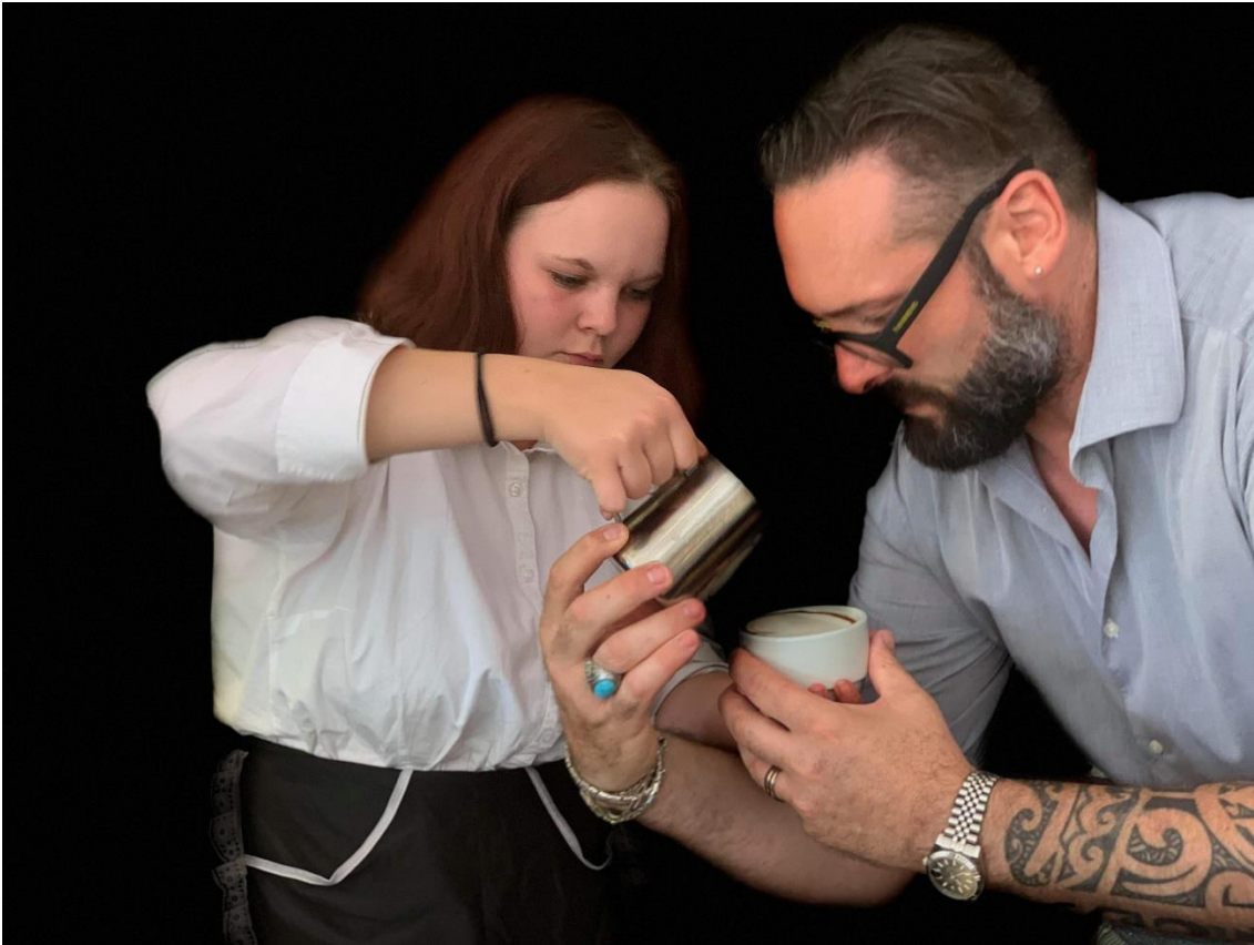
Obrázek 4 Škola vaření v Itálii

zmrzlinu připravovanou bez konzervantů z výběrových surovin. Navštívili jsme tradiční italské trhy pod širým nebem a nenechali si ujít vykoupání v moři.