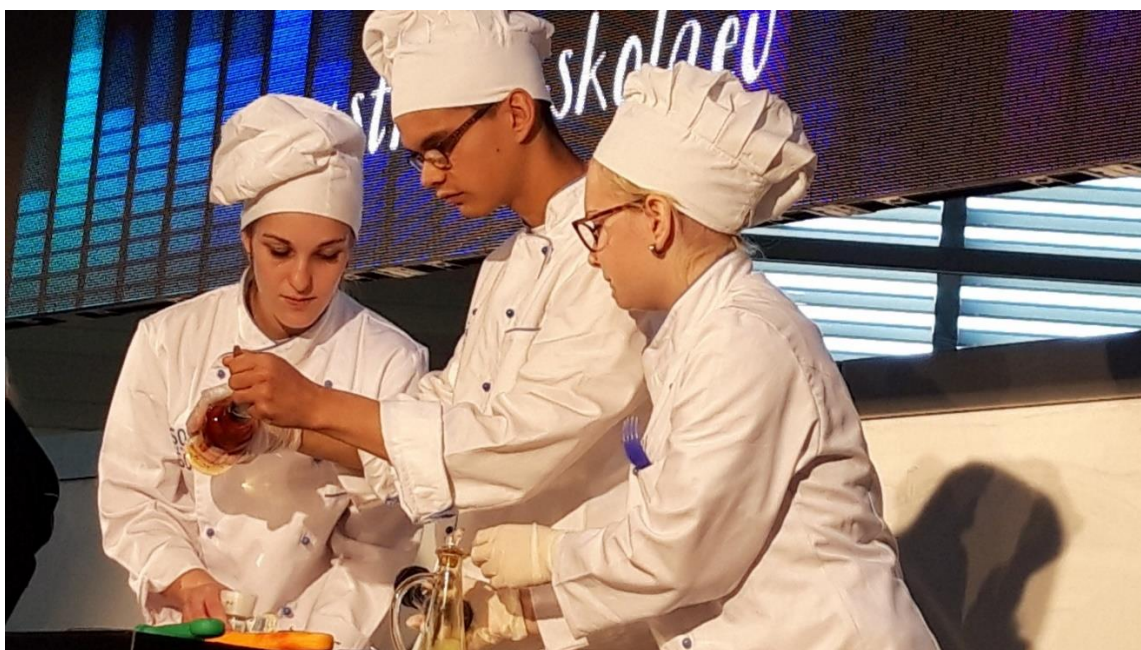
Obrázek 1: Vzdělání a řemeslo 2019, naši kuchaři v akci

Pravidelně se zúčastňujeme Burzy škol v Českém Krumlově a výstavy Vzdělání a řemeslo v Českých Budějovicích, na kterých prezentujeme obory vzdělání, které lze na naší škole studovat.