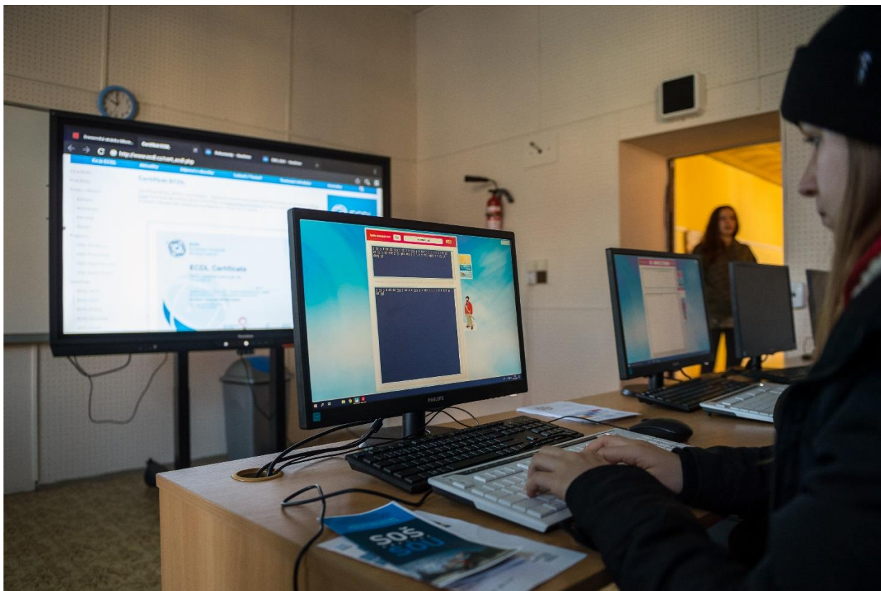
Obrázek 5 Nově vybavená ICT učebna

Šablony 2 pokračují i v následujícím školním roce, končí 30. 9. 2021.