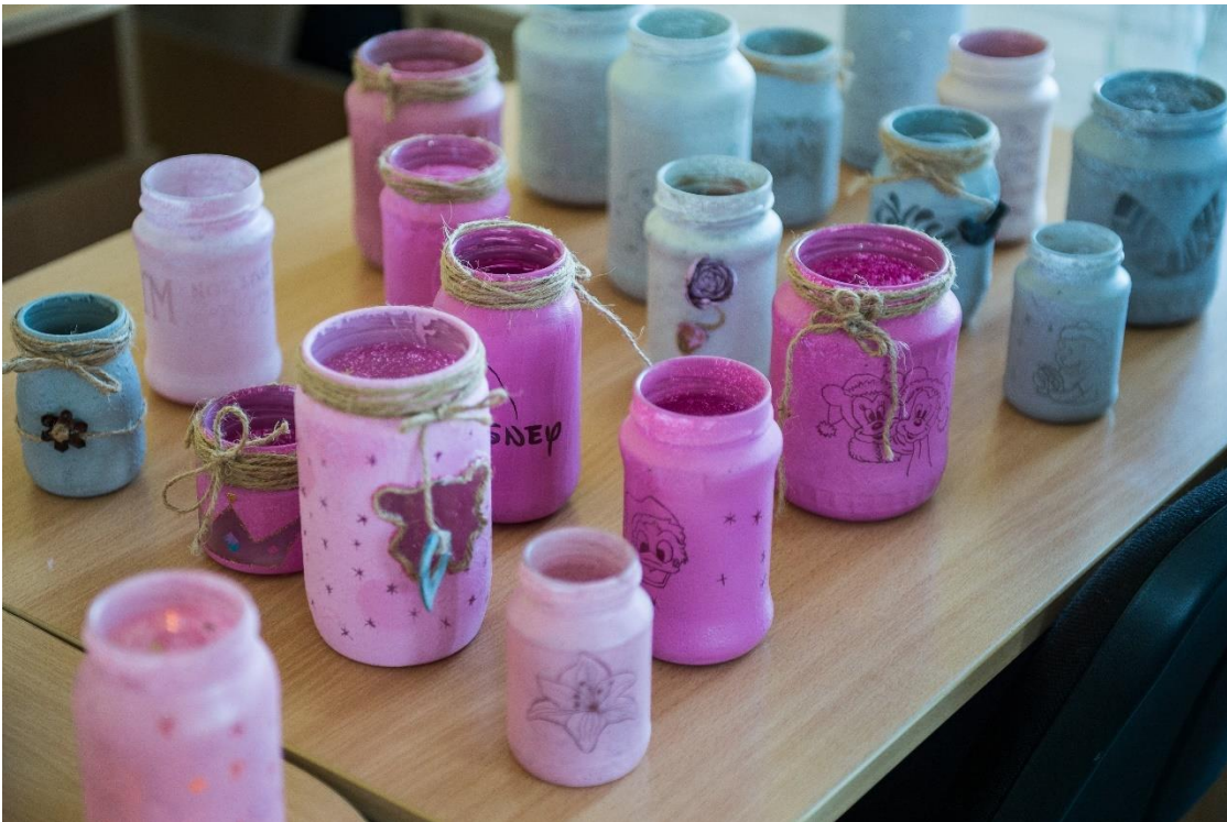
Obrázek 4 výrobky firmy Resto Company